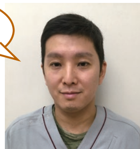
一般社団法人 日本獣医皮膚科学会

今を時めく講師お二人による「究極のコラボセミナー」、一人でも多くの先生方にご参加いただけたら幸いです。